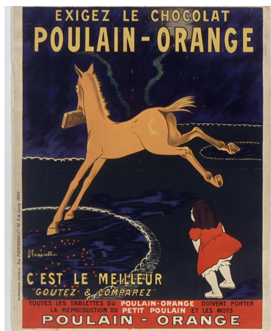
Exigez le chocolat Poulain orange, c'est le meilleur... Publicité de 1911 - Capiello, Leonetto (1875-1942)