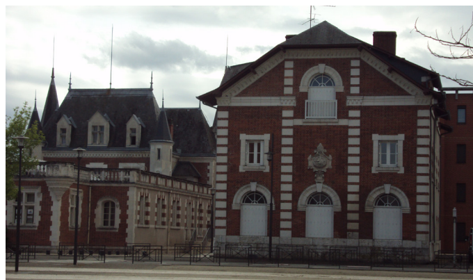
Château et ateliers Poulain à Blois

Loir-et-Cher - conduisent Poulain à envisager une nouvelle implantation. De 1862 à 1872, l'entreprise va progressivement se développer à l'ouest de Blois sur des terrains proches de la nouvelle gare. Dans les nouveaux bâtiments, des machines telles que moulins broyeurs, brûloirs à cacao, mélangeuses ou encore tapoteuses qui servent à égaliser le chocolat dans les moules et à éviter la formation de bulles d'air, apportent une aide précieuse aux ouvriers dont le nombre passe de 4 à 30. En 1872, Poulain vient habiter au cœur même de son usine dans un petit château en brique et pierre qui semble couronner sa carrière.