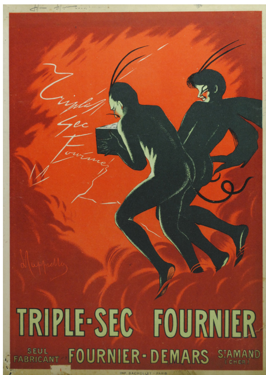
Publicité Fournier-Demars

cheminée en brique d'environ 25 mètres de haut. Le patron, surnommé « Monsieur Nénesse », fait régner une ambiance bon enfant et familiale. Son gendre devient par ailleurs directeur général en 1928. L'apéritif est offert midi et soir dans les années trente et les ouvriers, au nombre de 89 en 1939, emportent deux bouteilles au choix pour Noël. Les sources s'accordent à dire que les salaires sont réputés être les meilleurs de la ville, le samedi est chômé, et huit jours de vacances sont accordés par an : tout cela est signe d'une certaine prospérité. Suite à l'achat d'une toute petite parcelle à Vougeot, une succursale a également ouvert ses portes à Dijon en 1930, pour la fabrication de la crème de cassis « Royal Cassis », limitée au territoire communal de la capitale de Bourgogne par la loi de 1928 réglementant l'appellation « Cassis de Dijon ».