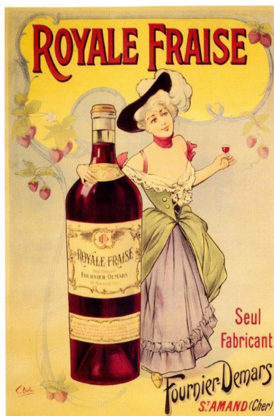
Publicité Fournier-Demars

à la réclame. Du contenant parfois luxueux, comme la carafe en cristal Saint-Louis, à la carafe à eau de bistrot et aux flacons en céramique, en passant par les cendriers, jeux de cartes et jetons de belote, les objets publicitaires sont nombreux et ciblent toutes les classes sociales. Les produits de la marque se retrouvent également sur des affiches. Le célèbre Capiello réalise par exemple des œuvres pour valoriser les « Un Fournier » et « Zeste », fidèles au style de l'époque, dans lesquelles des femmes aguichantes vantent les mérites des boissons de la maison. Pendant ce temps, la gent féminine berrichonne est à l'œuvre et travaille les fruits, notamment les cerises pour fabriquer le « Cherry-Brandy », comme en témoigne une carte postale du début du siècle. La « Sève Fournier » bénéficie quant à elle d'une autre publicité, en étant imprimée sur tous supports, dont des cartons de menus utilisés à diverses occasions, aussi bien un réveillon qu'un déjeuner estival de comice agricole.