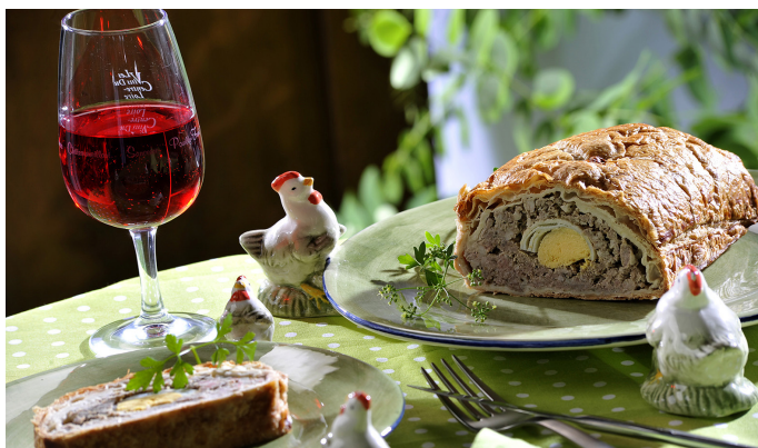
Pâté de Pâques

Certaines spécialités locales, souvent anciennes et héritées d'une tradition paysanne, sont clairement associées au territoire et leurs recettes se transmettent encore dans de nombreux ouvrages. Les deux plus connues demeurent certainement le pâté berrichon et la galette de pommes de terre. Pâté en croûte, comprenant de la viande et des œufs durs, le pâté berrichon n'est pas propre au Berry. On le trouve dans d'autres régions, mais sous l'appellation de Pâté de Pâques. Il n'est alors fabriqué que durant cette période. Dans le Berry, au contraire, on peut le trouver tout au long de l'année. C'est ce qui explique son appellation spécifique de Pâté berrichon.