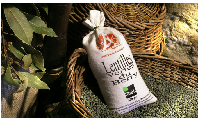
Lentilles vertes du Berry

Le patrimoine culinaire berrichon se caractérise donc d'abord par un côté assez roboratif, hérité d'une tradition rurale : les repas se devaient d'être riches et consistants, pour permettre aux paysans d'assurer leur journée de travail. Les produits sont issus du jardin ou du travail de la ferme, et permettent de proposer des plats simples mais goûteux. Cependant, il ne faut pas s'arrêter à cette seule caractéristique paysanne car « la cuisine berrichonne, cuisine solide à l'origine, a su évoluer en sachant garder sa saveur. Sensiblement allégée, elle a su conserver son naturel et cette poésie que ces nouvelles recettes font encore flotter au-dessus des fourneaux de l'ancien temps » (Benard Tardif et Alain Nonnet, Les recettes gourmandes du Berry, p. 11). L'apport dans ce domaine de grands chefs, tel Alain Nonnet, le créateur du restaurant gastronomique La Cognette, à Issoudun, est indubitable.