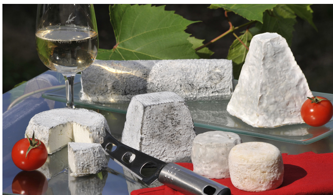
Fromages de chèvre

Si certains produits sont difficilement rattachés au Berry malgré leur localisation, d'autres jouent au contraire sur l'aspect patrimonial et historique pour tenter de se développer. C'est par exemple le cas des « potions de sorcières », thés et infusions de la gamme « Agat d'iau » (forte averse dans le patois berrichon), qui entretiennent justement la tradition de sorcellerie souvent associée au territoire.