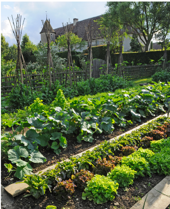
Potager du Prieuré d'Orsan

De nouveaux légumes originaires d'Italie font leur apparition en Val de Loire : artichauts (dont raffole Catherine de Médicis), cardons, asperges, choux-fleurs... À partir de la fin du XV e siècle, la présence de la cour et le microcosme qu'elle entraîne dans son sillage (officiers royaux, artisans de luxe...) suscite d'ailleurs une demande inédite en fruits et légumes fins. Dès le XVI e siècle, les paysans des Varennes tourangelles, ces terres limoneuses en amont et en aval de Tours, cultivent légumes et fruits, ce qui constitue pour eux une source de profits éminemment intéressante. C'est à ce moment que la province gagne sa réputation de « jardin de la France ». Pour ne donner qu'un exemple, c'est dans le château de Blois qu'est acclimatée pour la première fois en France, une petite prune de couleur verte-dorée. Selon Camerarius, un botaniste allemand du XVI e siècle, le fruit aurait transité par la Grèce puis l'Italie avant d'arriver dans le Val-de-Loire. On lui donnera le nom de « reine-claude », en hommage Claude de France, épouse de François I er .