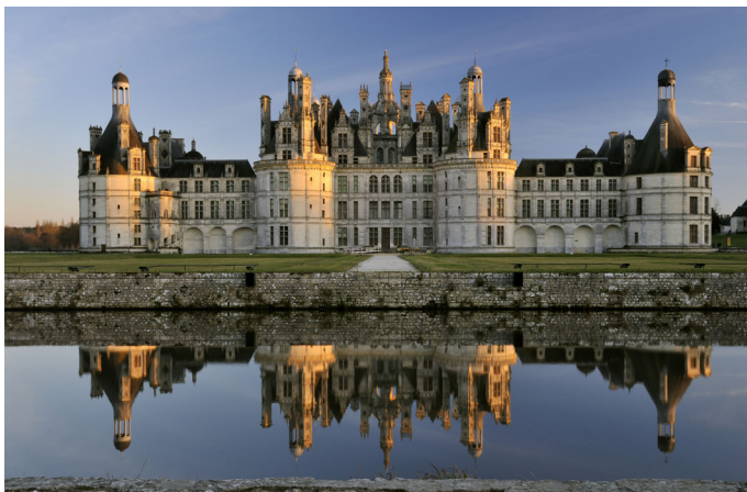
Château de Chambord

Le millénaire médiéval s'achève avec les règnes de Louis XI (marqué par l'essor des villes d'Amboise et de Tours) puis celui de Charles VIII : ce dernier, après son mariage avec Anne de Bretagne au château de Langeais, transfère la cour à Amboise. Son successeur, Louis XII, décide quant à lui de faire de Blois sa résidence principale.